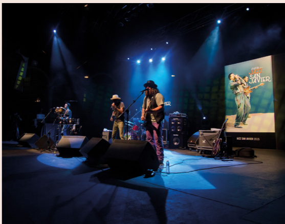
Festival Internacional de Jazz de San Javier en julio.