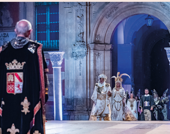
Moros y Cristianos de Murcia en septiembre.