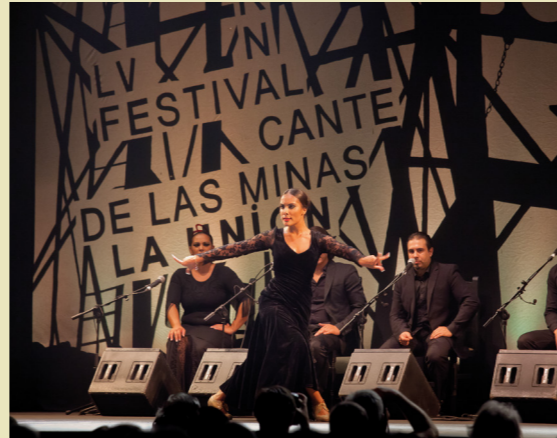
Festival Internacional del Cante de las Minas de La Unión en agosto.