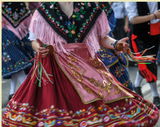
Bando de la Huerta de Murcia en abril.