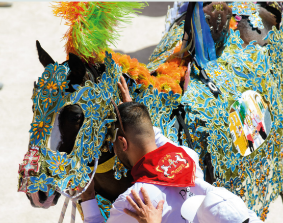
Los Caballos del Vino de Caravaca de la Cruz en mayo.