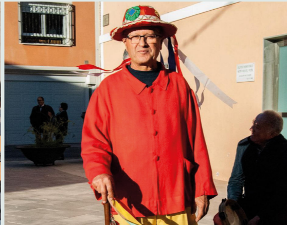
Fiestas de San Antón y Baile del Inocente. La Copa de Bullas en enero.