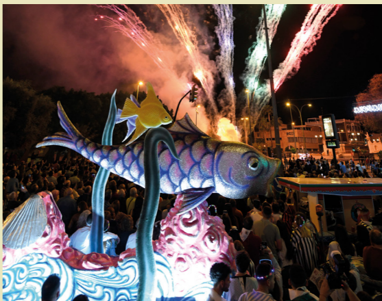
Entierro de la Sardina de Murcia en abril.