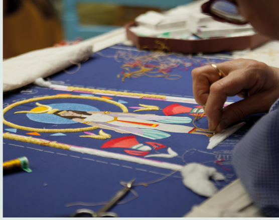
Tradición del Bordado en Lorca.