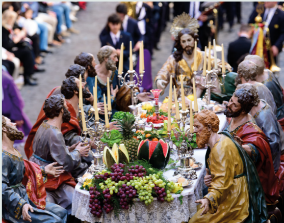
La Mañana de Salzillo de Murcia entre marzo y abril.