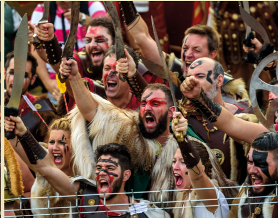
Fiestas de Carthagineses y Romanos de Cartagena en septiembre.