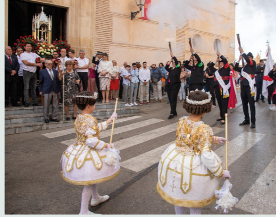
Fiestas de La Cruz de Abanilla en mayo.