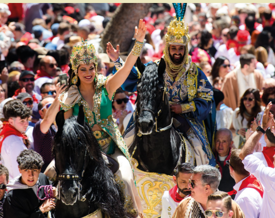
Fiestas en Honor de la Santísima y Vera Cruz de Caravaca en mayo.