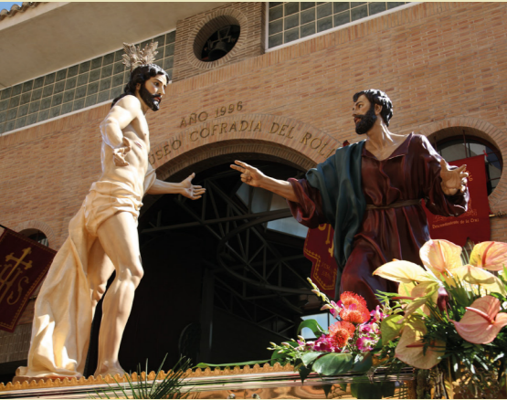
Semana Santa de Jumilla entre marzo y abril.