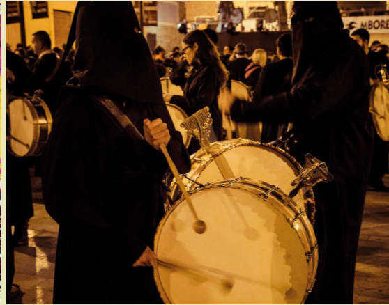
Noche de los Tambores de Mula entre marzo y abril.