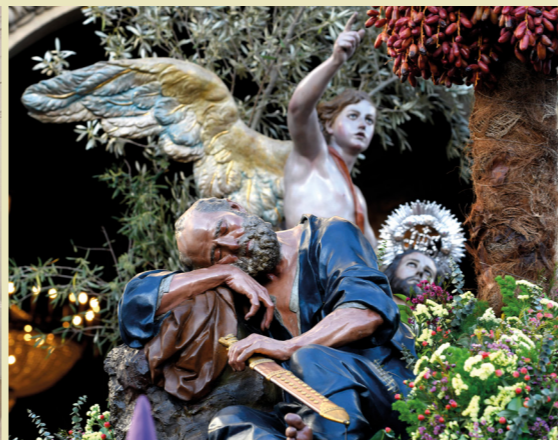
Semana Santa de Murcia entre marzo y abril.