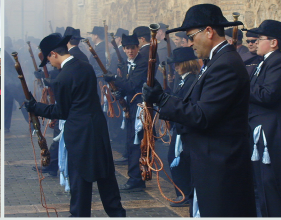
Fiestas de la Virgen de Yecla en Honor a la Purísima Concepción en diciembre.