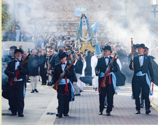
Fiestas de la Virgen de Yecla en Honor a la Purísima Concepción en diciembre.