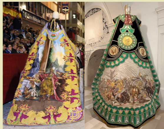
Semana Santa de Lorca entre marzo y abril. Izq. Paso Blanco / Dcha. Paso Azul.