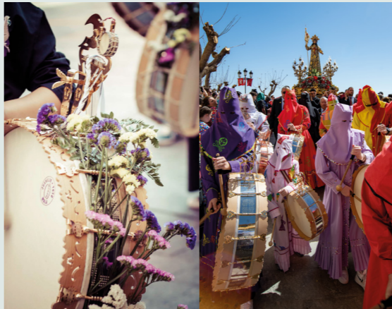
Fiesta de los tambores o tamborada de Mula y Moratalla entre marzo y abril. Izq. Mula / Dcha. Moratalla.