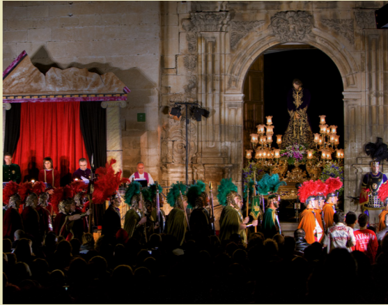
Semana Santa de Cieza entre marzo y abril.