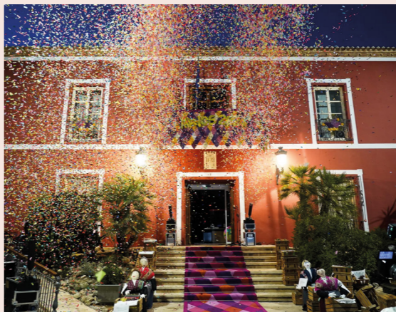
Los Mayos de Alhama en mayo.