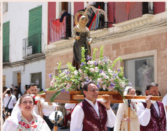
Fiestas de San Isidro Labrador de Yecla en mayo.