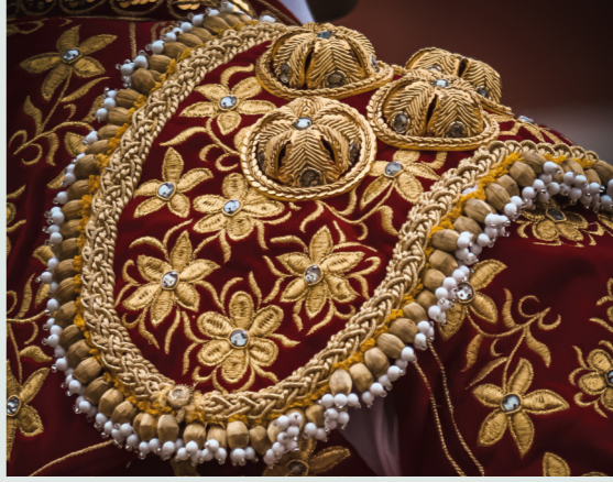
Fiestas de los Toros en la Región de Murcia.

Fiestas de la Región de Murcia Mucho que celebrar 2025