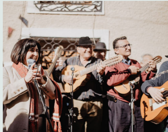
Fiesta de las Cuadrillas de Barranda en Caravaca de la Cruz en enero.