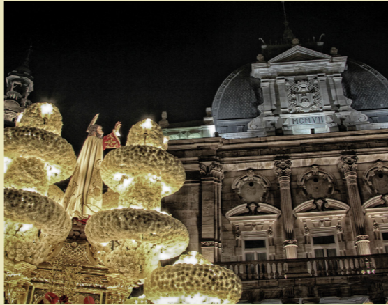
Semana Santa de Cartagena entre marzo y abril.