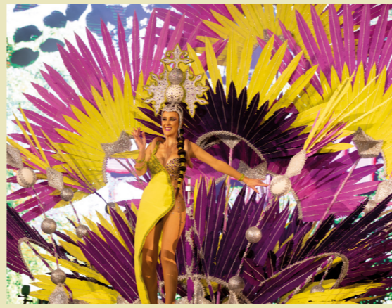
Carnaval de Águilas en febrero.